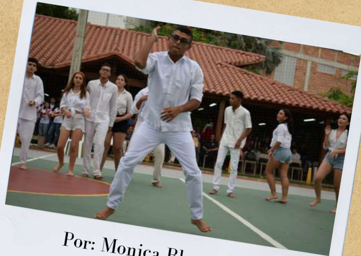
Por: Monica Blanco

Definitivamente esta fué una increíble tarde para todos, llena de música, baile, color, sabor y sobre todo mucho respeto y comunión.