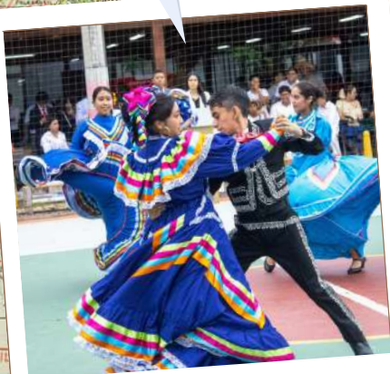
Por: Esteban Ruiz.